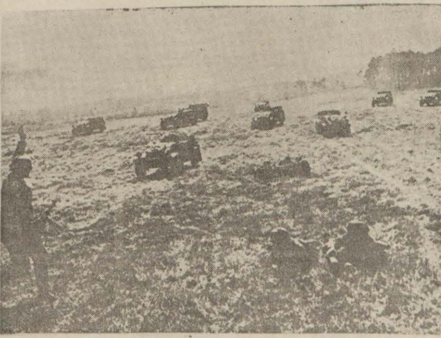
Şark cephesinde bir Alman motörlü kolu

Millî bayramınız münasebetiyle ve bütün İngiliz milletini size hitab ediyoruz. Size yalnız dost tabiriyle değil, aynı zamanda müttefik tabiriyle hitab ediyoruz. Zira Bordeaux hâdiselerindenberi geçen iki yıl zarfında müşterek düşmana karşı mücadelede devam etmek suretiyle sadık müttefikler olduğunuzu isbat ettiniz. (Devamı 5 inci sayfada)