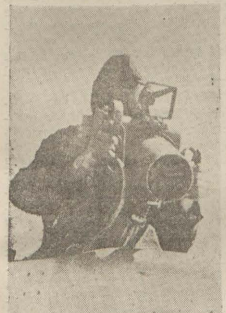
Bir İngiliz tayyarecisi düşman topraklarında bombalanan hedeflerin resimlerini alıyor

Alman tebliği, siviller arasında kayıplar olduğunu, binaların hasara uğradığını bildiriyor