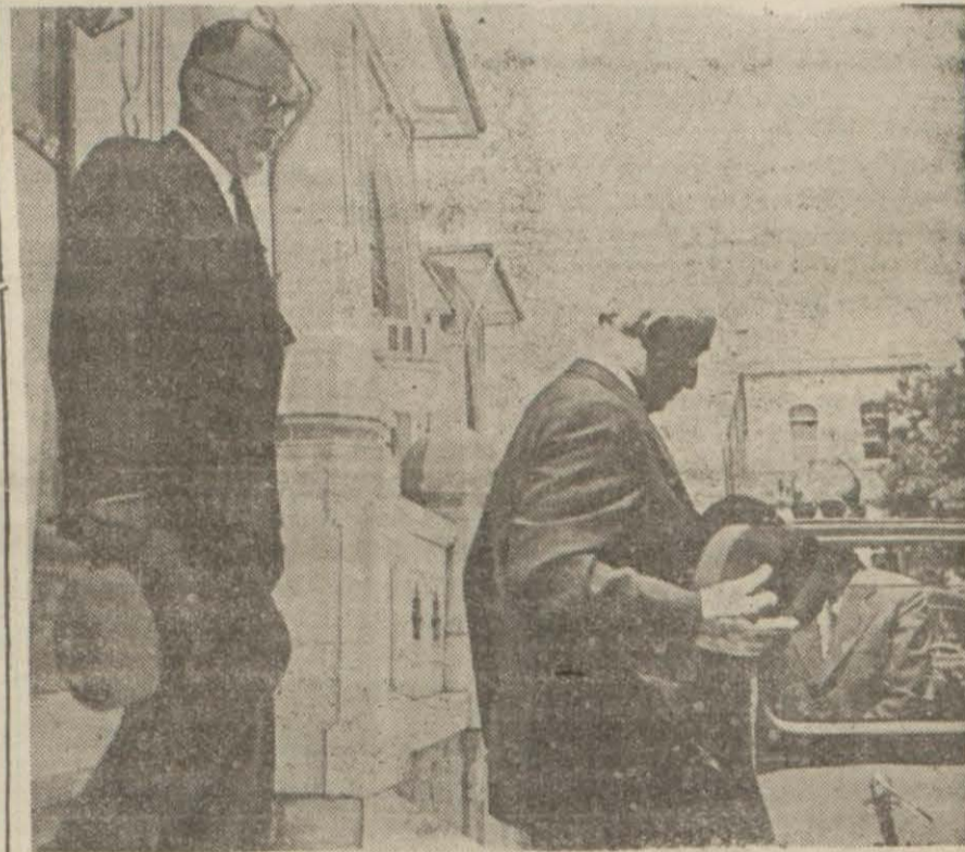
Millî Şef Başvekaletten ayrılırlarken

Nevyork, 14 (A.A.) — Sanayi teşekkülleri kongresi; Ruzvelt hitaben yarım milyon kartpostal dağıtmağa başlamıştır. 250 teker. küllün delâletile dağıtılan bu kartlarda hiç vakit geçirmeden bir ikinci cepheye ihtiyaç olduğu söylenmektedir.