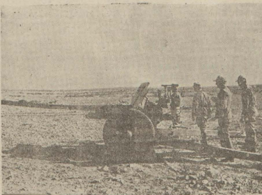
Mısırda bir Alman tanksavar topu faaliyetleri

Berlin, 14 (A.A.) — Alman orduları başkomutanlığının tebliği: Doğu cephesinin cenub kesiminde Alman taarruz cephesi cenuba doğru büyütülmüştür. İnad. (Yazısı 5 inci sayfada)